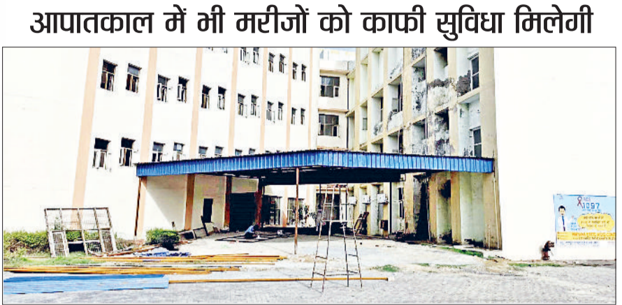
जीट। गायनी वार्ड के लिए रास्ता बन कर हुआ तैयार।

जिला मुख्यालय स्थित नागरिक अस्पताल में आने वाले मरीजों को बेहतर सुविधाएं मिले, इसके लिए स्वास्थ्य प्रशासन लगातार काम कर रहा है। पहले गायनी वार्ड को पुरानी बिल्डिंग से नई बिल्डिंग में शिफ्ट किया गया ताकि महिलाओं को उपचार के लिए परेशानी न हो। क्योंकि नई बिल्डिंग में ही आप्रेशन वार्ड व आप्रेशन के बाद जच्चा व बच्चा को ठहराने के लिए वार्ड है। ऐसे में अब गायनी वार्ड के पास ही चार फीट चौड़ा नया गेट बन कर तैयार है। इसके अलावा रैंप व रैंप के ऊपर अब शेड भी लग कर तैयार हो गया है। अब डिलीवरी के बाद महिलाओं को एंबुलेंस के लिए मुख्य गेट तक नहीं जाना पड़ेगा। सोधे गायनी वार्ड के पास ही एंबुलेंस सुविधा जच्चा व बच्चा को उपलब्ध होगी। शेड इसलिए लगवाया गया है ताकि बारिश के