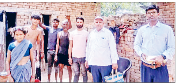
नगूरों ईट भद्दा पर मजदूरों के स्वास्थ्य की जांच करती स्वास्थ्य विभाग की टीम।

जीट। हरियाणा सरकार द्वारा डिजिटल सेवाओं को आधुनिक बनाने के उद्देश्य से पुराने ई-दिशा सिस्टम को सरल एवं सीआरएस पोर्टल से जोड़ा गया था। लेकिन इस डिजिटल परिवर्तन की प्रक्रिया अब आम नागरिकों के लिए गंभीर परेशानों का कारण बन गई है। पुराने रिकॉर्ड्स नए सिस्टम में सफलतापूर्वक माइग्रेट न होने के कारण अनेक परिवार वर्षों से सरकारी कार्यालयों के चक्कर काटने को मजबूर हैं। इसी प्रकार का एक मामला सामाजिक संगठन अन्ना टॉम के समक्ष आया। जिसमें मूल रूप से कैथल निवासी लेकिन वर्तमान में अहमदाबाद (गुजरात) में रह रहा एक परिवार पिछले लगभग तीन वर्षों से जन्म प्रमाण पत्र संबंधी समस्या के समाधान हेतु विभिन्न सरकारी कार्यालयों में भटक रहा है।