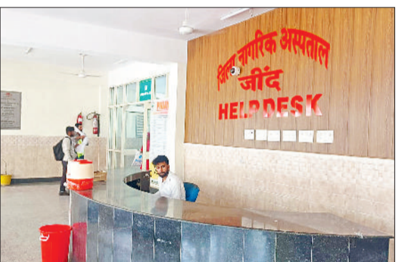
जीद। गर्मी के चलते नागरिक अस्पताल में रखावा गए कैपर।

हरिभूमि न्यूज ►► जीद नौतपा के पहले दिन सूर्य देवता ने अपना रौद्र रूप दिखा कर आमजन को घरों में दुबकने को मजबूर कर दिया है। आसमान से बरस रही आग गरम हवा के थपेड़ों से जनजीवन अस्त व्यस्त हो गया है। इसका असर दिनचर्या पर साफ देखने को मिल रहा है। दिन में बाजार तथा सड़कों पर सन्नाटा पसरा रहता है। रात को भी गर्मी से राहत नहीं मिल पा रही है। बेलदार सब्जियों पर भी झुलसने का खतरा मंडराने लगा है।