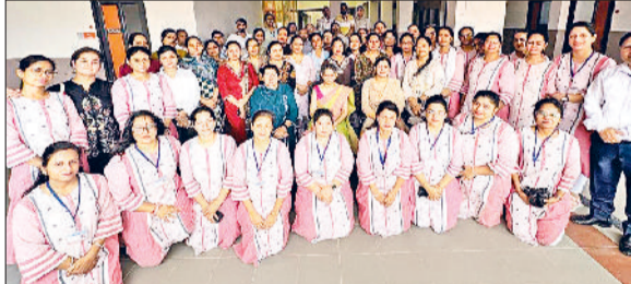
कैथल। कार्यक्रम के दौरान सिल्वर आक इंटरनेशनल स्कूल के स्टाफ सदस्य।