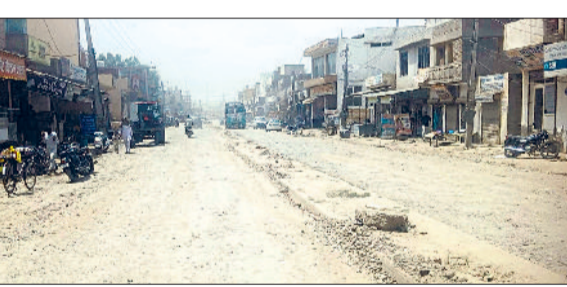
असंध-कैथल मार्ग पर अघूरे निर्माण कार्य से सड़क पर उड़ रही धूल का दृश्य।